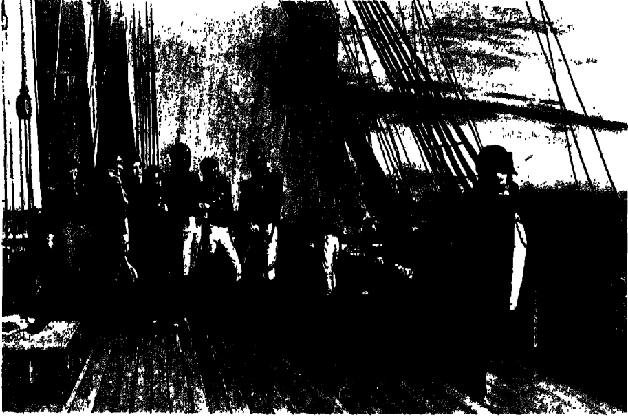
ناپليون على ظهر الباخرة بيلروفون، في تموز ١٨١٥